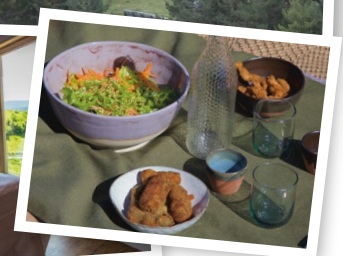
Àpat/brena a l'aire lliure

VOLS SABER MÉS SOBRE EL NOSTRE PROJECTE ECOTURÍSTIC? VISITA: