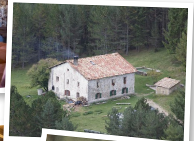
Refugi de Cuberes