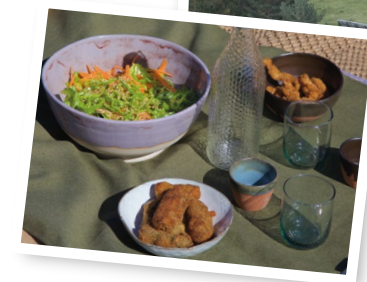
Àpat/brena a l'aire lliure

VOLS SABER MÉS SOBRE EL NOSTRE PROJECTE ECOTURÍSTIC? VISITA: