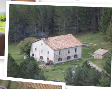
Refugi de Cuberes